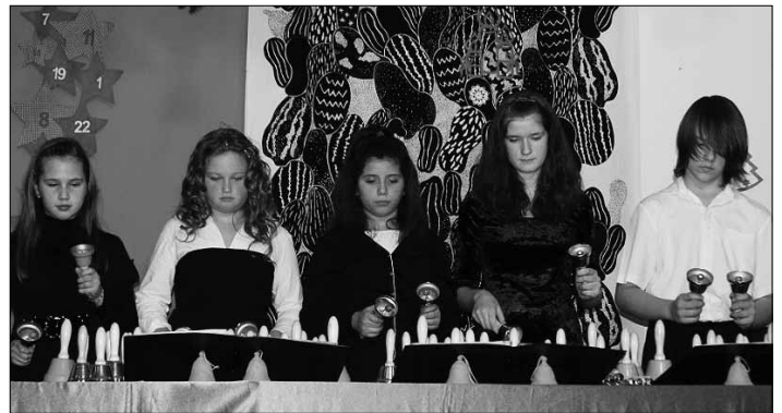
A Sziromka Utánpótlás együttes